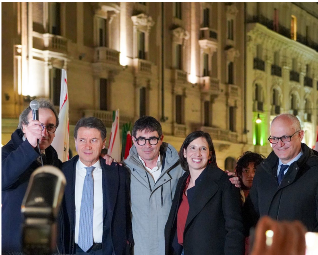
De verenigde oppositie op de avond van de overwinning bij het referendum.